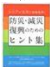
(災害に備える消費者教育の教材)