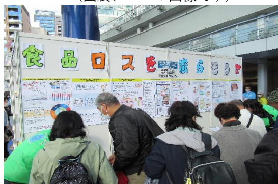
(出展ブースの画像です)