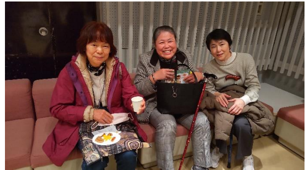
全国発酵サミットにて発酵食品の試食 11月26日(土) 恵那文化センター