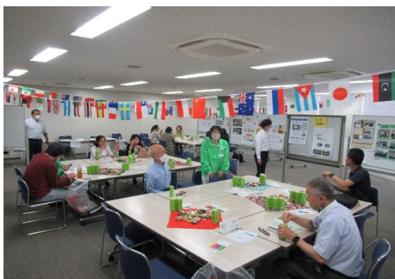
(交流会会場の様子です)