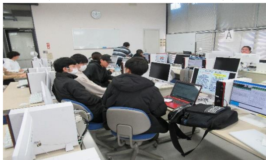
(グループワークの1コマです)