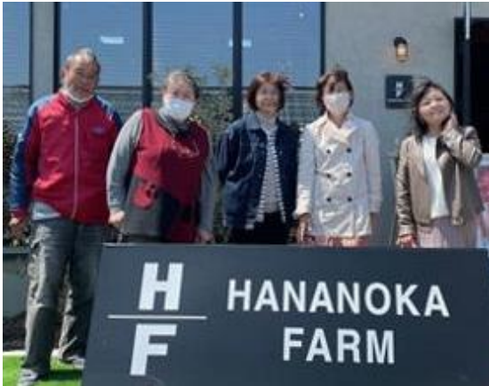
観光農園はなのかファームにて 4月9日(日) 瑞穂市